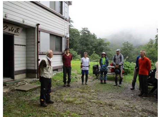
【出発前、渋谷代表の挨拶】