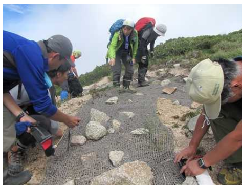
【ヤシネットへの植物の侵入状況を観察】