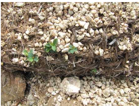
【ヤシ土嚢への植物の侵入状況】