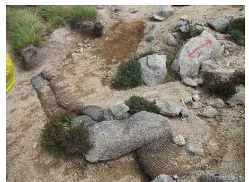
【砂防ダムの効果により土砂が堆積】