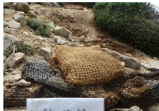
【1班 ヤシ繊維を混ぜた土嚢の設置】