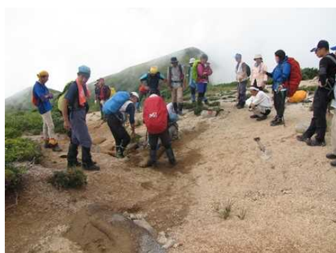
【ふりかえりの様子】